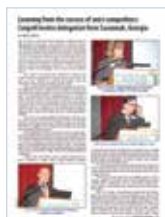
24 MARS 2014 PORT DE MONTRÉAL : AU CŒUR DE LA CHAÎNE D'APPROVISIONNEMENT GLOBAL Canadian sailings