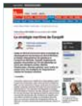
2 AVRIL 2014 LA STRATÉGIE MARITIME DE CARGOM La Presse