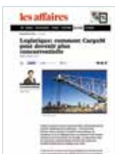
21 JANVIER 2014 LOGISTIQUE : COMMENT CARGOM PEUT DEVENIR PLUS CONCURRENTIELLE Les affaires