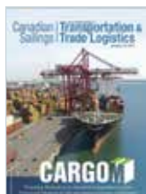
27 JANVIER 2014 CARGOM: PROMOUVOIR MONTRÉAL EN TANT QUE PLAQUE TOURNANTE MULTIMODALE Canadian Sailings