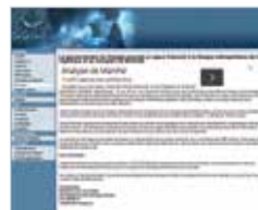
15 NOVEMBRE 2013 LE GOUVERNEMENT DU CANADA ACCORDE UN APPUI FINANCIER À LA GRAPPE MÉTROPOLITAINE DE LA LOGISTIQUE ET DU TRANSPORT DE MONTRÉAL Lelézard