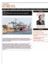
17 DÉCEMBRE 2013 PORT DE MONTRÉAL, PORTE D'ENTRÉE DES AMÉRIQUES Magazine Forces