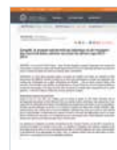
19 JUIN 2013 ASSEMBLÉE ANNUELLE DES MEMBRES CargoM