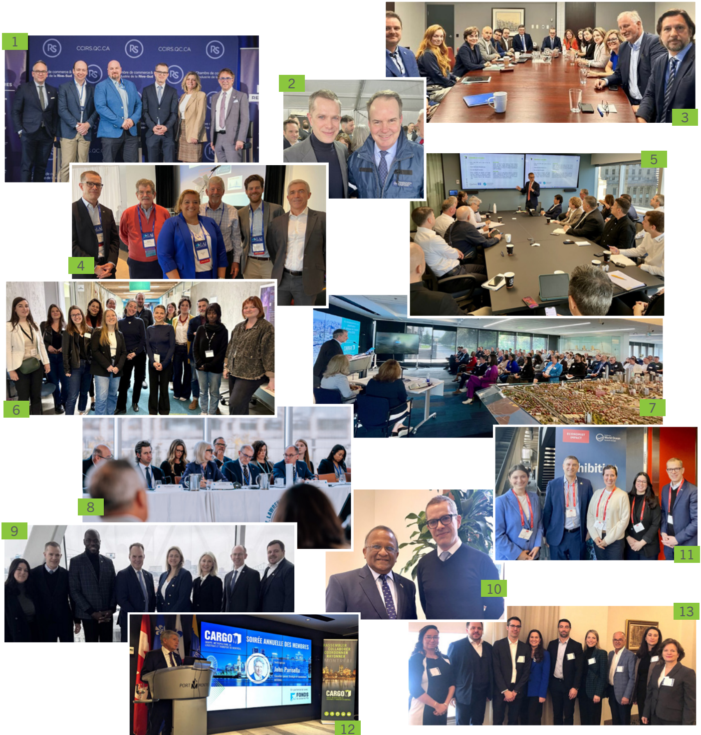
1. Grande Rencontre stratégique: Défis et opportunités du transport sur la Rive-Sud • 2. Inauguration officielle de la 68 e saison de la Voie maritime du Saint-Laurent • 3. Rencontre des grappes avec la ministre Christine Fréchette • 4. Panel sur les infrastructures de Lambda Alpha International (LAI) • 5. Présentation de CargoM à l'Eurailclusters • 6. Journée intergrappes • 7. AGA de CargoM • 8. Table ronde des leaders • 9. Rencontre avec le ministre des Transports, Steven MacKinnon • 10. Rencontre avec Alan DeSousa • 11. World Ocean Summit & Expo 2026 • 12. Soirée annuelle des membres de CargoM • 13. Rendez-vous des Armateurs du Saint-Laurent